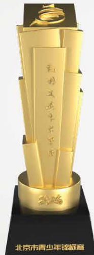
北京市青少年锦标赛